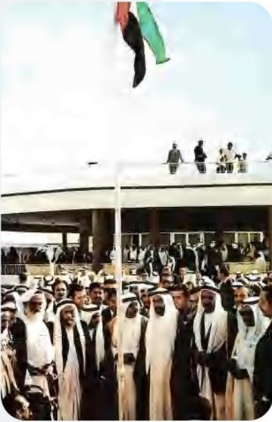
رفع علم الاتحاد في الثاني من ديسمبر 1971م

عندما أعلنت بريطانيا عام 1968 م عزمها عن سحب قواتها من منطقة الخليج العربي تجددت وقويت رغبة الحكام في إقامة اتحاد يجمع إمارات الخليج العربي، وقد مر الطريق نحو الاتحاد بمحطات رئيسية: