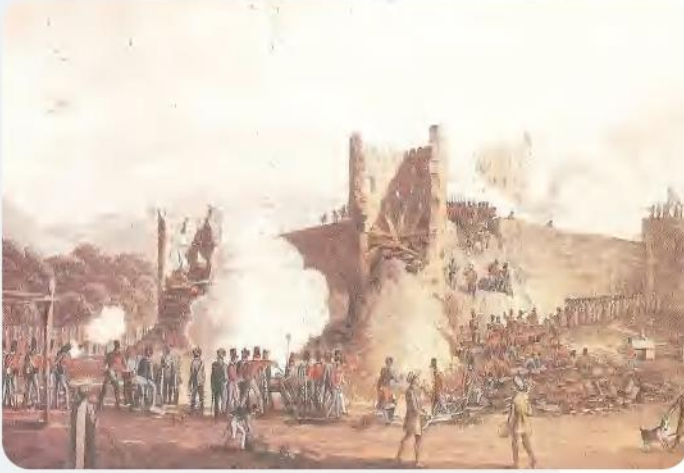
الهجومُ البريطانيُّ على رأسِ الخيمةِ 1819م

عاصرَ القواسمُ فترةً مهمةً من فتراتِ التنافسِ الاستعماري في الخليج العربيّ والمحيطِ الهندي، وأخذوا على عاتقهم تحديّ النفوذِ الإنجليزي الذي بدأ يتسرّب إلى المنطقة، ففي مناسباتٍ عديدةٍ كانت السفنُ البريطانيّةُ تعرّضُ قواربِ الصيّدِ العربيّة، وتطلقُ النَّارَ عليها مما دفعَ القواسمَ إلى الاشتباكِ مع السفنِ البريطانيّة، وألحقوا بهم خسائرَ كبيرة، فجهّزت بريطانيا حملاتٍ عسكريّةٍ للقضاءِ على قوتهم ونشاطهم البحريّ، ومن هذه الحملاتِ: