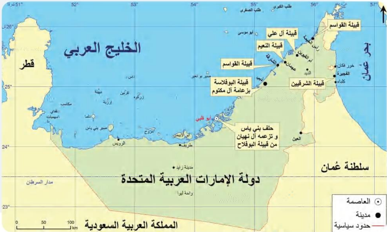
خريطة توزيع القبائل في دولة الإمارات العربية المتحدة